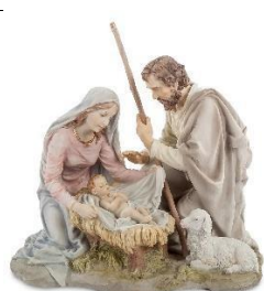
Б) Рождество Христово