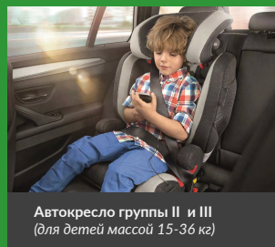
Автокресло группы II и III (для детей массой 15-36 кг)